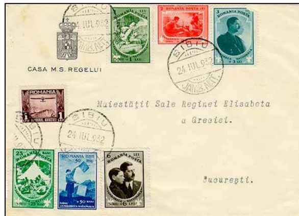
Fig. 18 - Scrisoare "alte localități" suprafrancată (francată filatelic)

Tot în această secțiune am putea include și mărcile fixe (M.F.) de pe întregurile poștale românești apărute în 1932. În tabelul 8 am clasificat aceste piese ținând cont de valoarea nominală, culoare și denumirea întregului [23]. Toate întregurile poștale au avut ca M.F. efigia regelui Carol II, neluând în calcul dimensiunea acestora, deoarece de la copierea machetei și până la tipărire s-au făcut abateri în limite admise în ceea ce privește dimensiunea M.F.