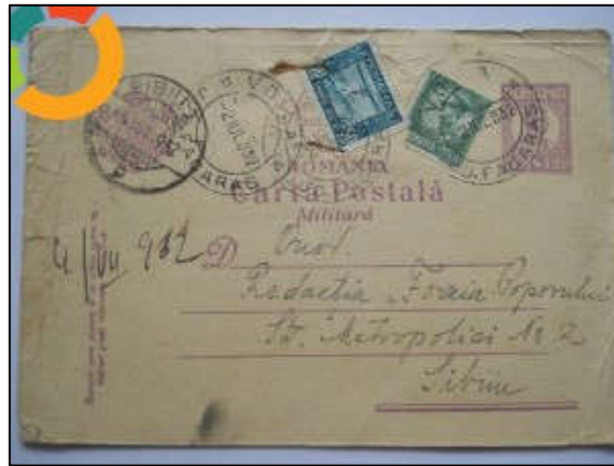
Fig. 9 - Carte poștală militară fără tratament special, tarifată ai domo unei CP

Cărțile poștale îndoite comerciale (CG) au fost admise oficial în serviciul poștal românesc ca obiecte de corespondență încă din data de 22 martie 1930. Ele erau cărți poștale particulare, reduse la dimensiunea unei cărți poștale simple, prin îndoirea unei părți din lărgimea lor pe partea adresei. Partea îndoită trebuia să fie perfect lipită pe partea adresei și nici un fel de corespondență nu trebuia scrisă pe acea parte, exceptând adresa destinatarului. Aceste CP erau utilizate doar de casele comerciale și industriale, având imprimate pe ele adresa firmei respective (fig.10).