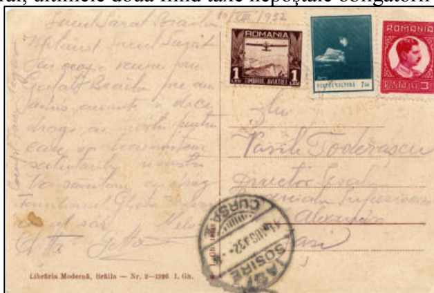
Fig. 7 - Reversul CPI din fig.5 în care se observă divizarea prin linie verticală a feței rezervate corespondenței și tarifarea corectă a piesei filatelice [9]

în vigoare la acea dată: 3 lei contravaloarea expedierii unei CPI cu timbrul aferent din emisiunea de uzuale Carol II + 1 leu timbrul aviației + 2 lei timbrul cultural, ultimele două fiind taxe nepoștale obligatorii (TNP).