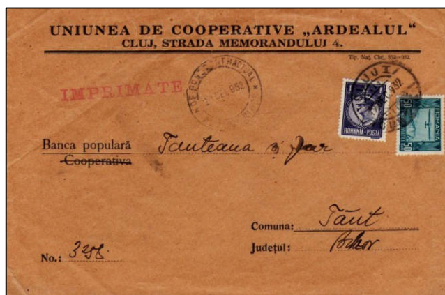
Fig. 11 - Întreg poștal, plic cu antet aparținând Uniunii de Cooperative "Ardealul" din Cluj-Napoca

Și unele categorii de scrisori oficiale aparținând unor societăți ce erau adresate unor bănci sau cooperative erau considerate imprimate dacă erau prezentate în plicuri cu antet, tipărite ca atare cu loc pentru număr de înregistrare. În fig. 11 întregul poștal prezentat are amprența ștampilei "IMRIMTAE", fiind înregistrat ca atare, și este tarifat cu timbrul de 1 leu din emisiunea de uzuale Carol II + timbrul de 50 bani reprezentând TAV.