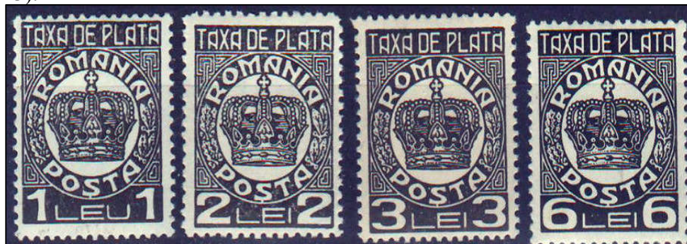
Fig. 13 - Cele 4 valori nominale ale emisiunii "Taxa de plată" Coroana

Taxa minimă a insuficienței de francare (TIF), cunoscută și sub numele de “Porto”, a intrat în vigoare la 1 aprilie 1922. Pe lângă taxarea dublă a insuficienței de francare a mai fost introdusă și o sumă minimă numită “minim de francare”, care trebuia plătită chiar dacă insuficiența de francare era mai mică. Scrisorile și obiectele de corespondență insuficient francate trebuiau șampilate cu o șampilă “T”, “Porto”, “De plată” sau cu o inscripție asemănătoare. Modalitatea de plată a acestei taxe se făcea prin aplicarea de timbre “Taxa de plată”. Dacă la începutul anului s-au folosit timbrele emisiunilor din 1930 și 1931, administrația poștală a emis în decursul acestui an o nouă serie cunoscută sub numele de “Coroana” (fig. 13).