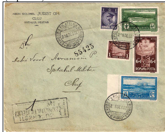
Fig. 2 - Scrisoare "alte localități" francată poștalo-filatelic

recomandare - TR) + 5 lei (taxa specială de sărbătoare - TSL, 20 noiembrie picând într-o duminică). Taxa de 1 leu Fondul aviației era o taxă obligatorie pe orice scrisoare internă - TAV. Suprataxa celor trei mărci era destinată Sanatoriilor PTT, fiind una benevolă (și acceptată de către expeditor odată cu utilizarea mărcilor respective pe corespondență). Cele trei timbre cu suprataxă constituie seria completă a emisiunii pusă în circulație pe data de 1 octombrie 1932 (L.p. 100).