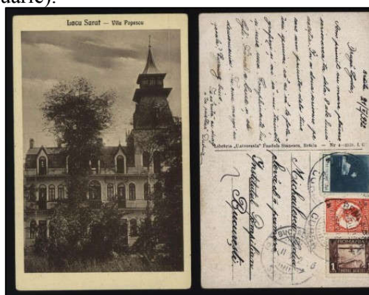
Fig. 6 - Carte poștală ilustrată tarifată corespunzător pentru finele lunii februarie

În 1932 au avut tarif poștal diferențiat (v. categoria CD din tabelul 1), acesta fiind de 4 lei, în prima jumătate a anului, și scăzând la 3 lei începând cu data de 1 iunie. În fig. 6 observăm tarifarea corespunzătoare la începutul anului [10]. Aceasta era compusă din timbrul de 4 lei din emisiunea de uzuale Carol II - 1932, la care s-au adăugat taxele nepoștale obligatorii: 1 leu timbrul aviației + 2 lei timbrul cultural (aflat în vigoare deja de la sfârșitul lunii ianuarie).