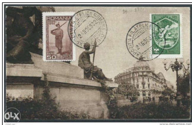
Fig. 8 - Carte poștală TCV ștampilată la Expoziția Filatelică Română EFIRO 1932 în data de 24 noiembrie. Timbrele aplicate sunt în concordanță cu tema și cu anul ștampilării [22].

Ca o mică paranteză, cercetătorul dr. Ioan Daniliuc în prefața lucrării sale [24] ne aduce la cunoștință că în 1932 (anul asupra căreia ne referim în materialul de față) Ilamando Lecestre, un colecționar de CPI din Melun, atribuie denumirea de ilustrată maximă (carte maximă) cărților poștale ilustrate pe fața cărora erau aplicate și obliterate mărcile poștale pe care le comercializa. Ceea ce le diferenția de simplele TCV-uri era faptul că exista o similitudine între imaginea cărții poștale și imaginea timbrelor care erau aplicate pe aceasta.