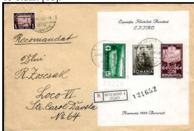
Fig. 12 - Scrisoare recomandată, expediată "loco", suprafrancată [18]

timbre din emisiunea Sanatorii PTT , unde 10 lei reprezintă taxa de recomandare și 2 lei taxa benevolă în folosul sanatoriilor; plus 1 leu - timbrul aviației - taxă nepoștală obligatorie la acea vreme. În anul 2011 această piesă a fost adjudecată pe site-ul de licitații eBay la valoarea de 353 de euro, după 15 biduri [18].