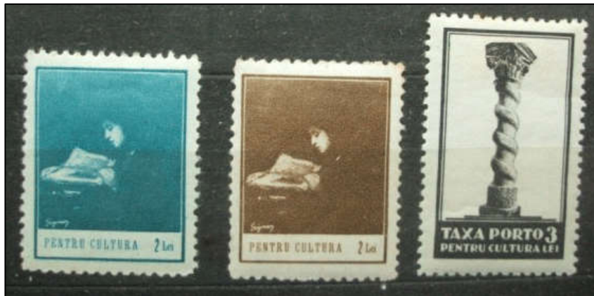
Fig. 17 - Cele două timbre ale emisiunii timbrului cultural și timbrul "Taxa PORTO"

Taxa timbrului cultural (TC) a apărut pe data de 28 ianuarie ca urmare a Deciziei Ministeriale privind monopolul cărților poștale ilustrate. Timbrul cultural (fig. 17) avea valoarea nominală de 2 lei și trebuia să se aplice pe cărțile poștale ilustrate care făceau obiectul Legii.