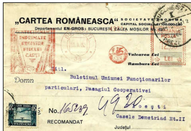
Fig. 10 - Carte poștală îndoită comercială tarifată corect

Cărțile poștale îndoite comerciale (CG) au fost admise oficial în serviciul poștal românesc ca obiecte de corespondență încă din data de 22 martie 1930. Ele erau cărți poștale particulare, reduse la dimensiunea unei cărți poștale simple, prin îndoirea unei părți din lărgimea lor pe partea adresei. Partea îndoită trebuia să fie perfect lipită pe partea adresei și nici un fel de corespondență nu trebuia scrisă pe acea parte, exceptând adresa destinatarului. Aceste CP erau utilizate doar de casele comerciale și industriale, având imprimate pe ele adresa firmei respective (fig.10).