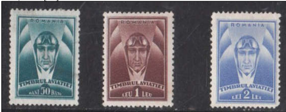
Fig. 16 - Seria "Timbrul Aviației. Pilot" pusă în circulație în noiembrie 1932

3229/17.11.1932, timbrele aveau un format de 21 x 26 mm, cu clișeul de 19 x 22,5 mm [21].