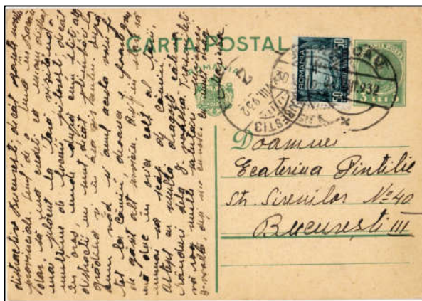
Fig. 4 - Carte poștală simplă cu timbru fix expedită în august 1932 [8]

În fig. 4 este prezentată o CP expedită la data de 29 august 1932 de la Bacău la București (sosită pe data de 30 august) și francată corespunzător cu timbrul fix de 3 lei la care se adaugă TNP - timbrul aviației în valoare de 50 bani .