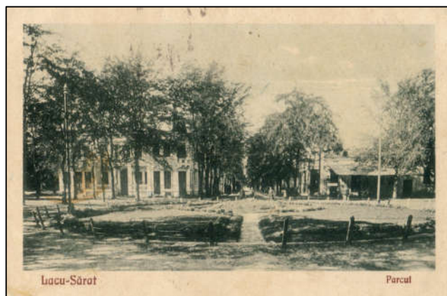
Fig. 5 - Carte poștală ilustrată editată de Librăria Modernă, cu date de identificare: Brăila - Nr.2 - 1926, I. Gh. 18248 [9]

În 1932 au avut tarif poștal diferențiat (v. categoria CD din tabelul 1), acesta fiind de 4 lei, în prima jumătate a anului, și scăzând la 3 lei începând cu data de 1 iunie. În fig. 6 observăm tarifarea corespunzătoare la începutul anului [10]. Aceasta era compusă din timbrul de 4 lei din emisiunea de uzuale Carol II - 1932, la care s-au adăugat taxele nepoștale obligatorii: 1 leu timbrul aviației + 2 lei timbrul cultural (aflat în vigoare deja de la sfârșitul lunii ianuarie).