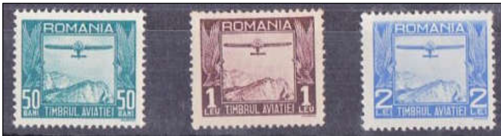
Fig. 14 - Timbrele emisiunii "Timbrul aviației" 15 mai 1931

crează – Fondul Național al Aviației – care se pune la dispoziția Președinției Consiliului de Miniștri”, iar în articolul 2 se precizează modalitatea prin care va fi alimentat acest fond: „Acest fond va fi realizat prin înființarea unui timbru mobil special denumit - timbrul aviației – care va fi emis de Ministerul de Finanțe și va fi pus în aplicare cu începere de la 1 Maiu 1931” [19]. Din aceeași sursă aflăm că FNA era capitalizat la Casa de Depuneri și Consemnațiuni, prin depuneri lunare de sume obținute în urma vânzării timbrului aviației. Depunerile erau făcute de Ministerul de Finanțe pe baza deconturilor efectuate lunar de Casa Autonomă a Monopolurilor. La începutul fiecărui an, Președinția Consiliului de Miniștri întocmea un buget special pentru timbrul aviației.